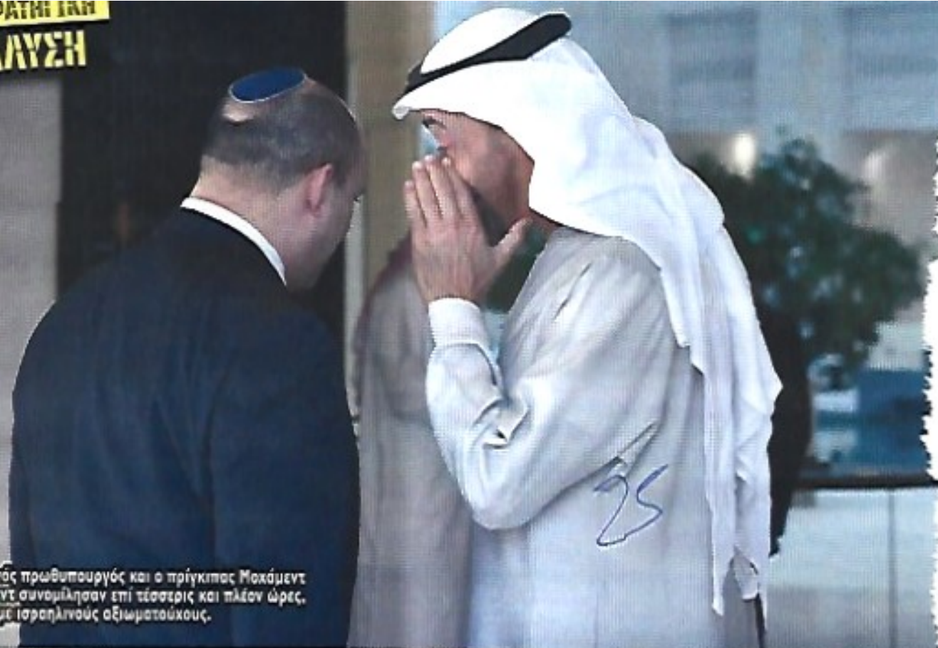
Ο Ισραηλινός πρωθυπουργός και ο πρίγκιπας Μοχάμεντ μπεν Ζάγιεντ συνομήλησαν επί τέσσερις και πλέον ώρες, σύμφωνα με Ισραηλινούς αξιωματούχους.