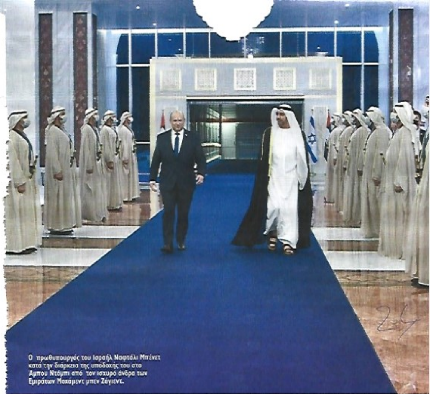
Ο πρωθυπουργός του Ισραήλ Ναφτάλι Μπένετ κατά την διάρκεια της υποδοχής του στο Αμπου Ντάμπι από τον ισχυρό άνδρα των Εμιράτων Μαχάμεντ μπεν Ζάγιεντ.

Ή ταν μια σκηνή που ελάχιστα ίσως και κανένας δεν θα πίστευε μέχρι πριν από μερικά χρόνια πως θα μπορούσε να συμβεί. Και όμως ένας Ισραηλινός πρωθυπουργός, ο Ναφτάλι Μπένετ, μπήκε σε ένα από τα αεροπλάνα, που πλέον πραγματοποιούν καθημερινές πτήσεις ανάμεσα στις δύο χώρες, και επισκέφθηκε το Αμπου Ντάμπι στα μέσα Δεκεμβρίου.