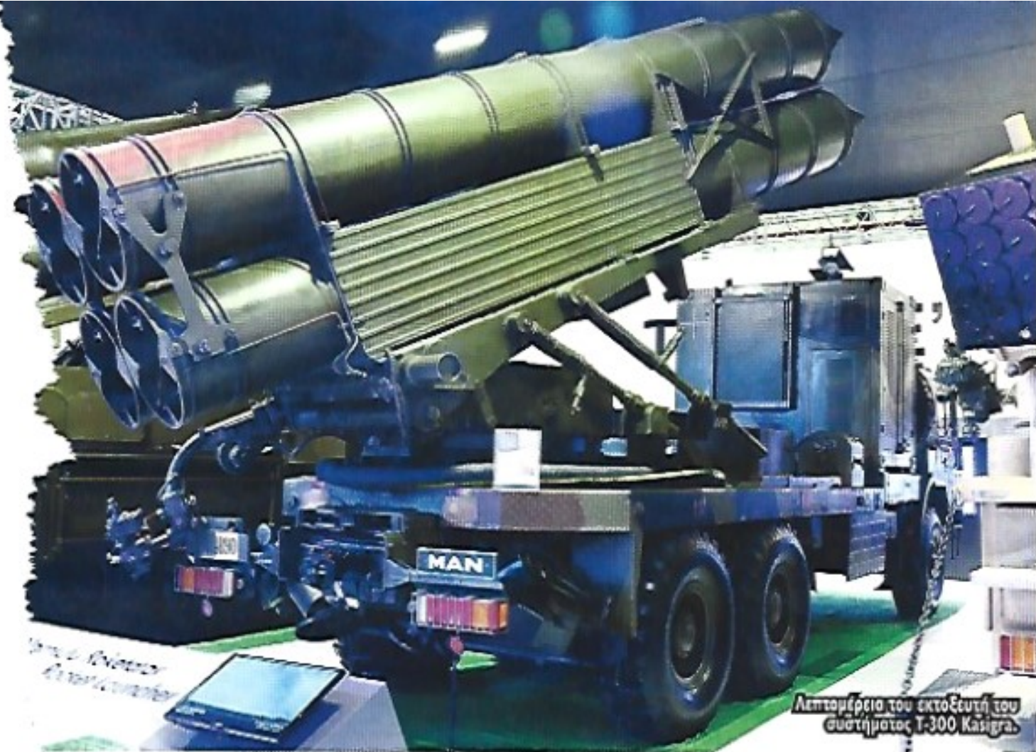
Λεπτομέρεια του εκτοξευτή του συστήματος T-300 Kasirga.

Πρακτικά η TR-300S είναι μια "-300F" με ένα δαικτύλιο ο οποίος εκκείνεται σαν αερόφρενο συζώνοντας την οπισθέλκουσα, με αποτέλεσμα το μέγιστο ταχύτητα να φτάνει τα 60 κλμ. και το ελάχιστο τα 40 κλμ. Παρόμοιας διαμόρφωσης είναι και το μικρότερο εμπέλειας σύστημα T-107/122.