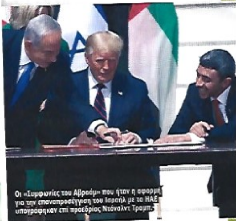
Οι «Συμφωνίες του Αβραάμ» που ήταν η αφορμή για την επαναπροσέγγιση του Ισραήλ με το ΗΑΕ υπογράφηκαν επί προεδρίας Ντόναλντ Τραμπ.